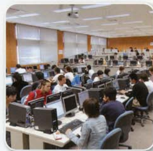
コンピュータ実習室