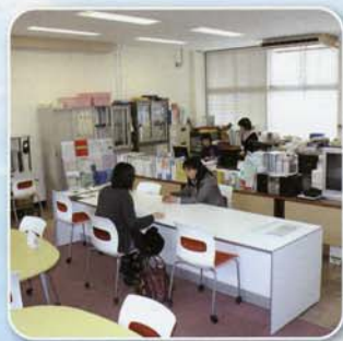
キャリアセンター